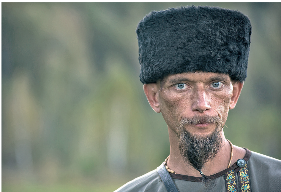
Олинчук Руслан, г. Барнаул. «Казачьи гуляния». Потомки казаков форпоста, основанного в 1765 году русскими для защиты от набегов кочевников, проводят празднества. Они сохранили свои традиции и стараются передать их следующим поколениям.