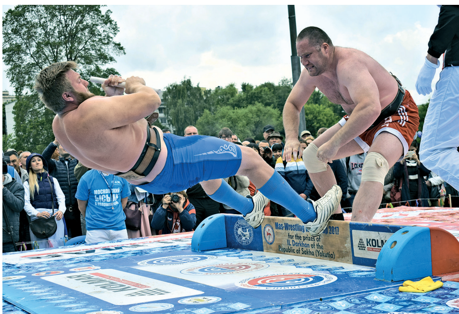
Донская Сардана, Москва. Из серии «Московский ЫСЫАХ» в Коломенском. Ежегодно Якутский Новый год «ЫСЫАХ» собирает москвичей и якутов, живущих в Москве, на национальный праздник.