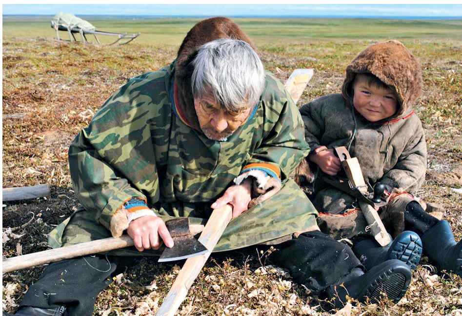
Яр Марина, ЯНАО, г. Лабытнанги. «Передача опыта»; процесс заготовки нарт и обучения этому мастерству подрастающего поколения. Ненцы, ЯНАО, Гыданский п-ов.