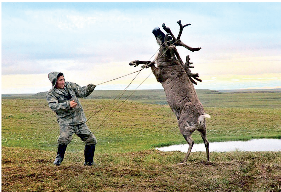
Яр Марина, ЯНАО, г. Лабытнанги. «Укрощение строптивого»; человек тундры с большим уважением относится к своему оленю, даже если он пытается показать своё превосходство над хозяином. Ненцы, ЯНАО, Гыданский п-ов.